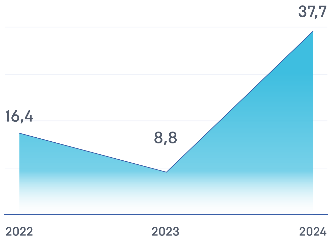
Обороты фонда, млн руб.